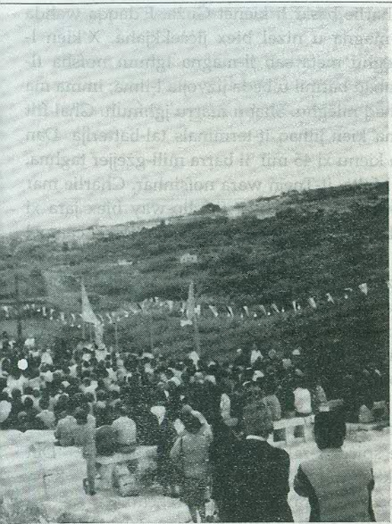
ta' Mejju 1993.